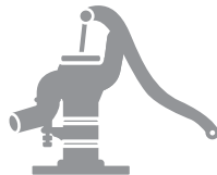
農業用の井戸・水道